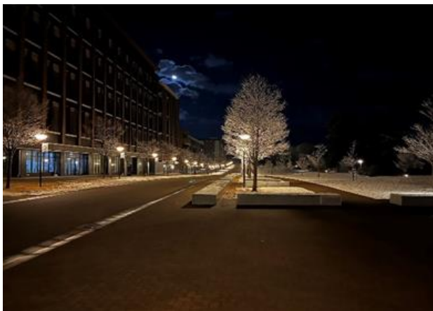
前 根 優 也 (機知・航空令5) 医工学研究科医工学専攻修士1年