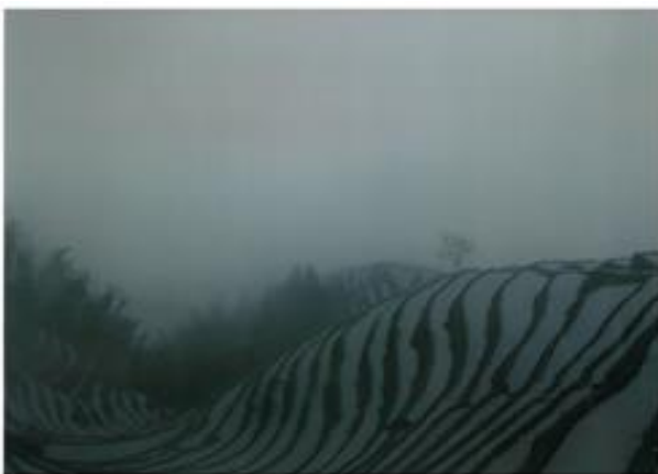
石 宇航 金属フロンティア工学専攻修士 2年