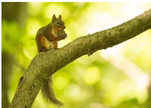
千葉 雅樹 (材料平 22) 多元物質科学研究所・職員