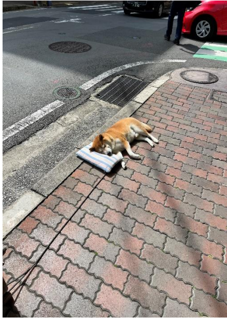
宮口 純平 機械知能・航空工学科 3年