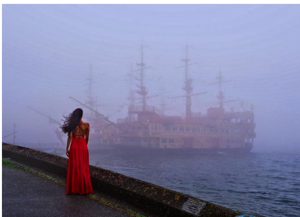
中川 宣雄 (応昭 45)