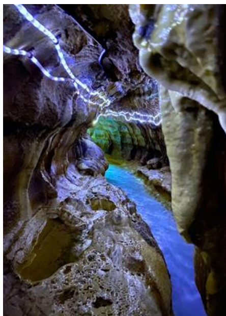
高橋 一吹 化学・バイオ工学科 4年